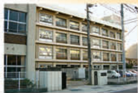
国分寺南部小学校 1,000m~1,150m