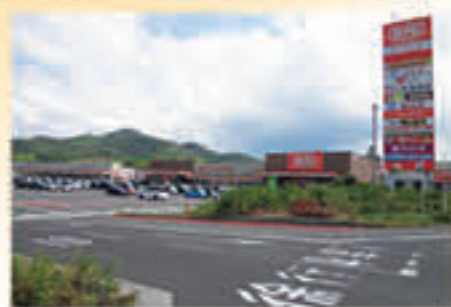
イオンタウン国分寺 750m~900m