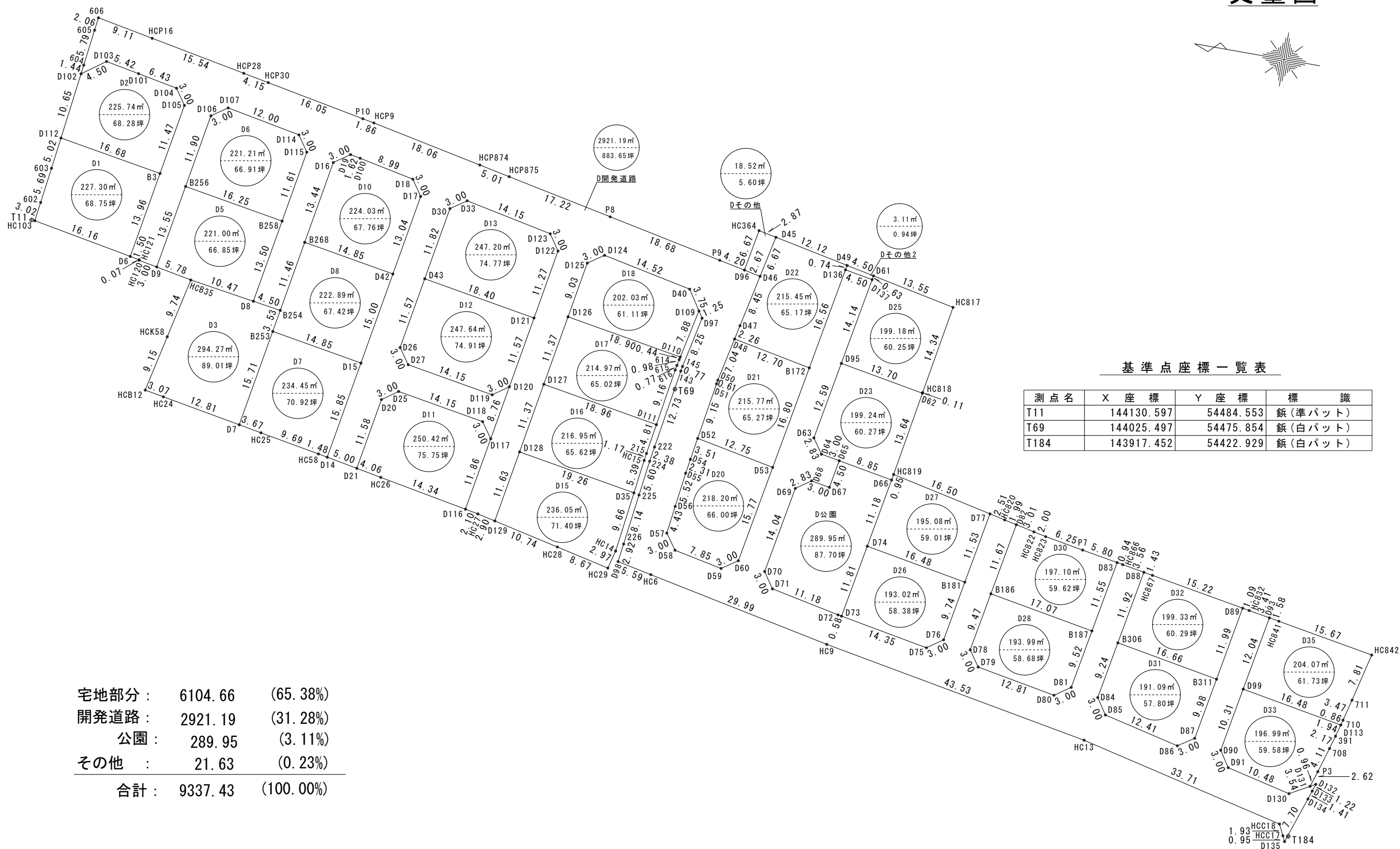
基準点座標一覧表